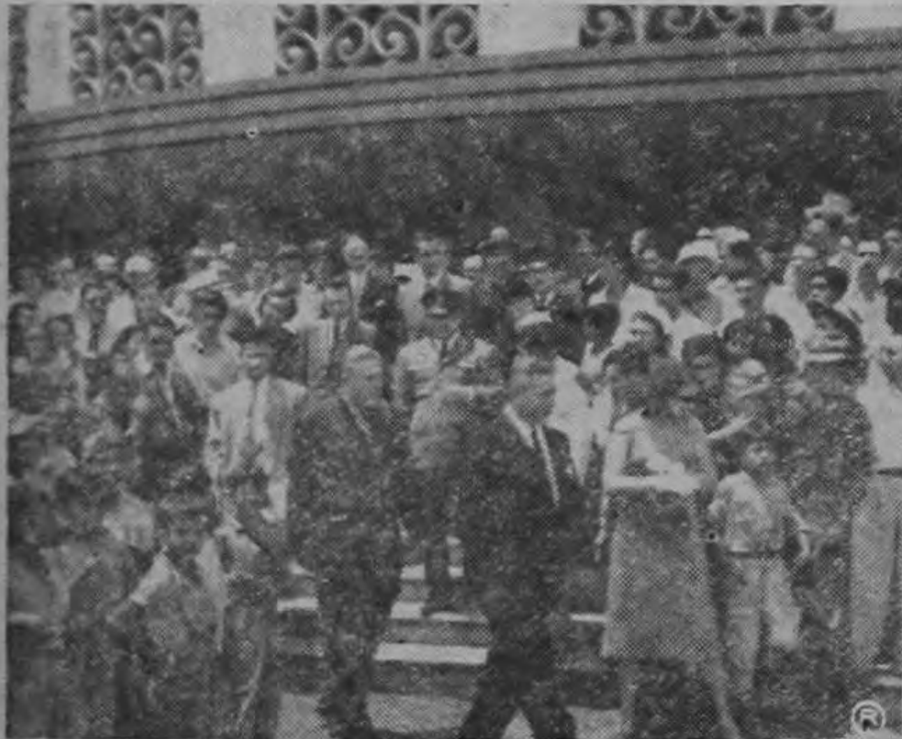
Los presidentes Ulate y Osorio dejan el Palacio Nacional después del memorable desfile escolar que produjo honda impresión en el ánimo del mandatario costarricense.

En el caso concreto de El Salvador, el tratado comercial aseguraría un excelente mercado para nuestras maderas, en momentos en que el progresista Gobierno de El Salvador tiene en marcha un vasto programa de construcciones, a través del Instituto de la Vivienda Urbana y Rural, sin contar con el impulso que en el mismo orden de cosas está recibiendo la iniciativa particular.